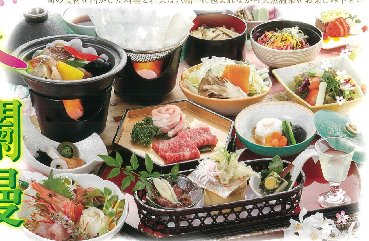
※写真は錦コースのイメージです。