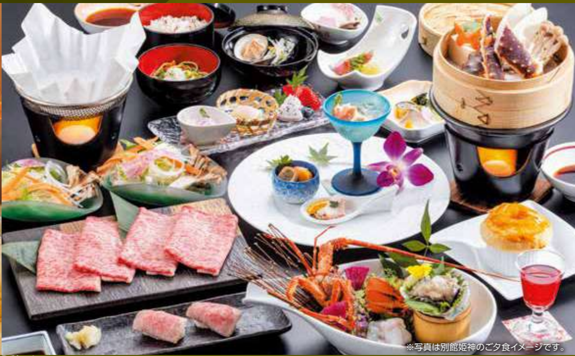
※写真は別館姫神のご夕食イメージです。